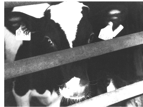
Eines der Milliarden Opfer der Fleischindustrie

Dieses Herrschaftsverhältnis wird Speziesismus genannt und hat für Tiere fatale Konsequenzen: Sie werden zu Opfern eines Macht- und Unterdrückungsverhältnisses, in dem ihre Existenz alleine an den Bedürfnissen der Menschen orientiert ist. In diesem speziesistischen Gewaltverhältnis werden Tiere systematisch ausgebeutet, u.a. zu Milch-, Eier- und Fleischlieferanten erklärt, als Versuchsobjekte degradiert, oder in Zoo und Zirkus zur Schau gestellt.